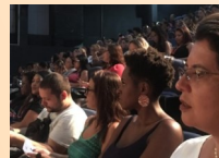
Educação Antirracista e a Rede de Proteção aos Direitos das Crianças e Adolescentes, 21/02/19