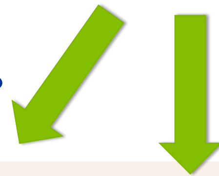
Anexo VII - Comparativo entre a estimativa de receita e a transferência realizada