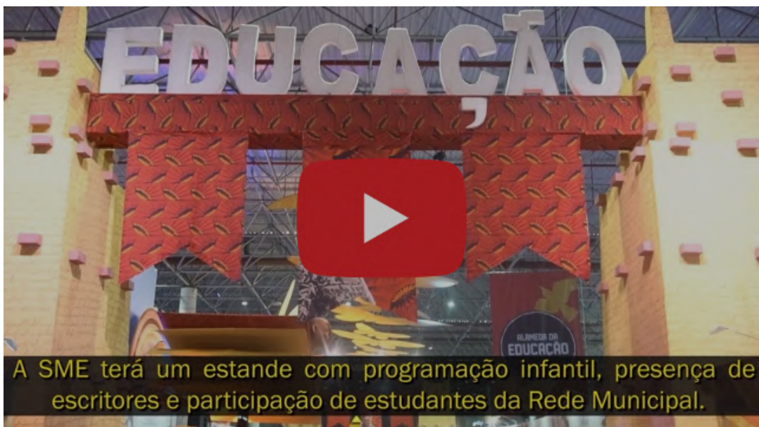
Boletim da Educação em vídeo

Confira as outras edições do Boletim da Educação aqui.