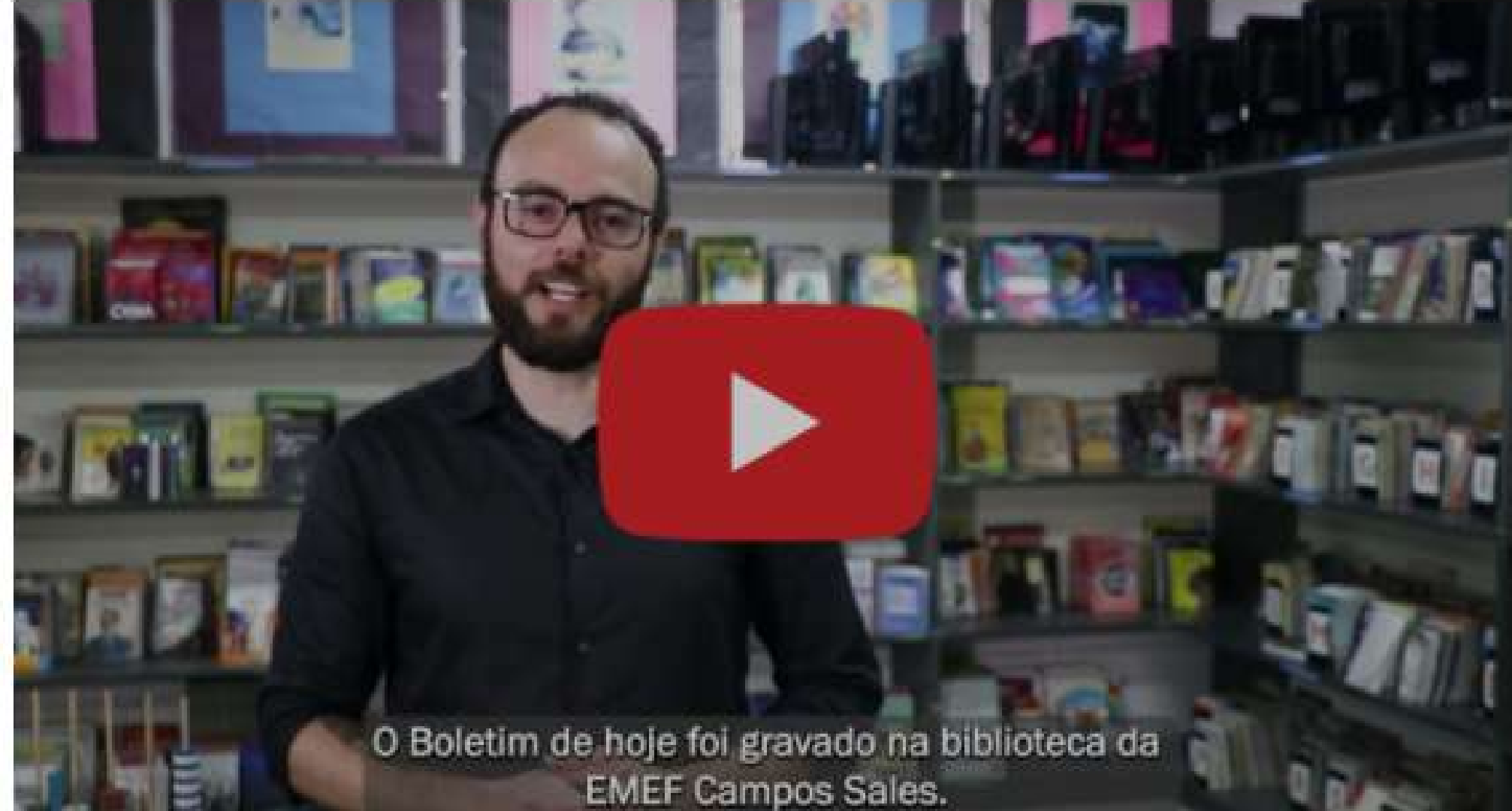
O Boletim de hoje foi gravado na biblioteca da EMEF Campos Sales.