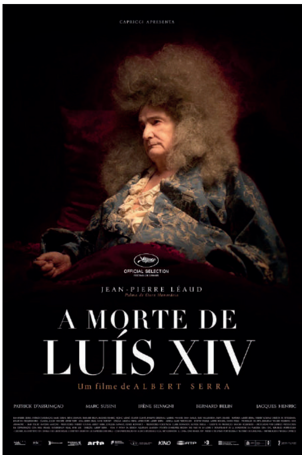
CARTAZ DO FILME: A MORTE DE LUÍS XIV (2016).

Disponível em: http://www.adorocinema.com/filmes/filme-247006/ . Acesso em: 30 jul.2017.