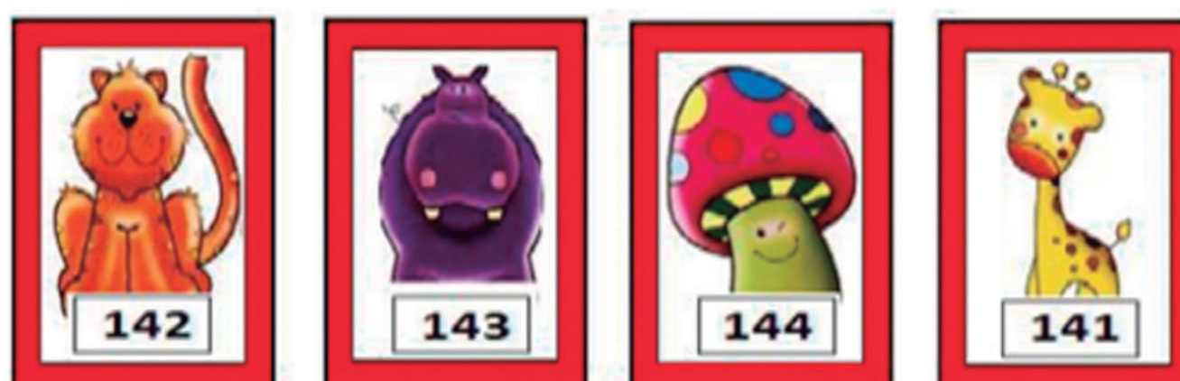
IMAGEM: ELABORADO PELA SME/COPED/NTA